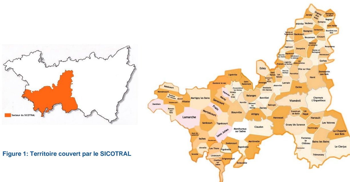
Figure 1: Territoire couvert par le SICOTRAL