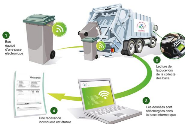
Figure 2: Principe de fonctionnement de la pesée embarquée

4/ Facturation : Edition d'une facture détaillée, 2 fois par an.